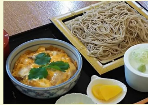
ミニ親子丼セット