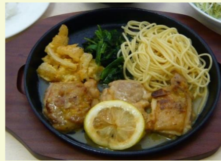
チキンソテー定食