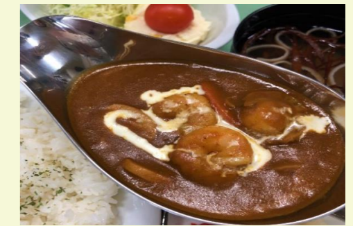
シーフードカレーセット