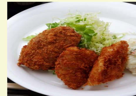
ミックスフライ定食