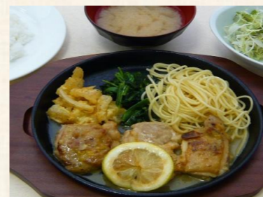
チキンソテー定食