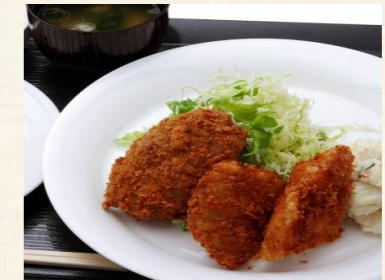
ミックスフライ定食