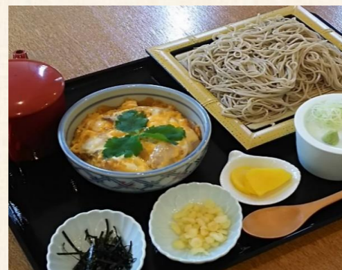
ミニ親子丼セット