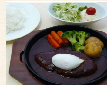
デミハンバーグ定食