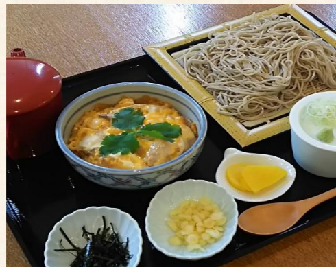
ミニ親子丼セット