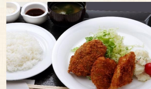
ミックスフライ定食